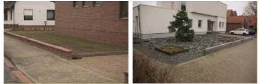
Lebensraum für Wildbienen?

Blumenwiesen dürfen nicht gedüngt werden!!!