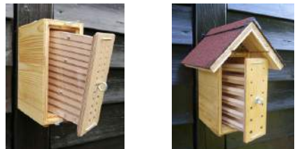
Beobachtungsröhren aus atmungsaktivem Holz, nur teilweise mit Acrylglas abgedeckt

Markhaltige Stängel, die man waagrecht anbringt, werden von Wildbienen in der Regel nicht angenommen (s. Abschnitt 3.8)