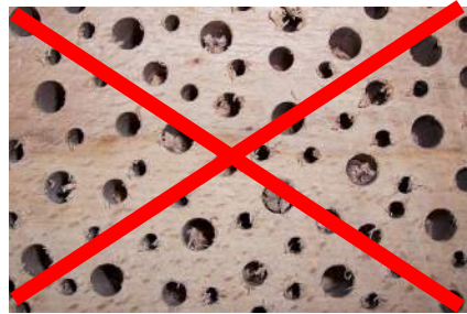
Hier gehen keine Wildbienen rein!