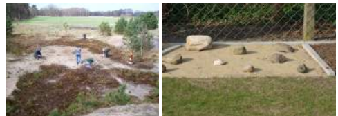
Rest-Binnendüne als natürlicher Lebensraum und Ersatzfläche im Garten