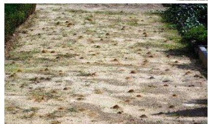
Massenvorkommen der Raufußigen Hosenbiene