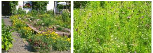
Besser so!